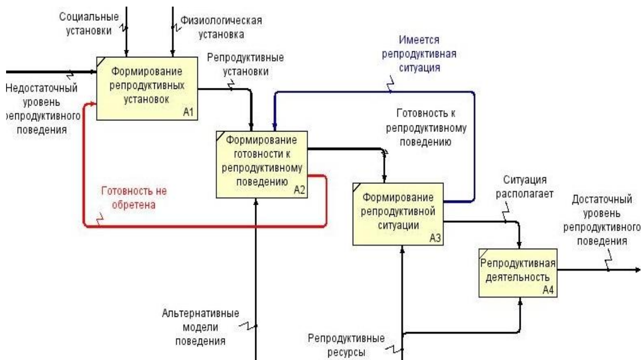
Рис. 2. Диаграмма декомпозиции первого уровня функционально-структурной модели реализации репродуктивного цикла в молодежной среде

Таким образом, мы видим, в каких неопределенных условиях происходит формирование репродуктивных установок молодежи.