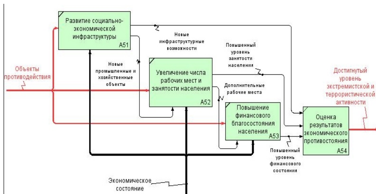
Рис. 3. Диаграмма декомпозиции второго уровня в контуре повышения экономического благосостояния ТО-ВЕ (как должно быть)

Для иллюстрации реализации одного из механизмов противодействия на рис. 3 представлена диаграмма декомпозиции второго в контуре повышения экономического благосостояния ТО-ВЕ (как должно быть)